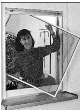
Neher-Systeme im Internet: http://www.neher.de

Das raffiniert ausgeklügelte System für einen zuverlässigen Insektenschutz. Vom einfachen Spannrahmen über Drehrahmen, Drehtüren bis hin zu ganzen Schiebeanlagen oder Insektenschutzrollen. Absolut umweltfreundlich aus zierlichem Aluminium-Profil und einem kaum sichtbaren Fiberglasgewebe. Einfach perfekt.