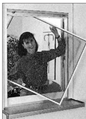
Neher-Systeme im Internet: http://www.neher.de

Das raffiniert ausgeklügelte System für einen zuverlässigen Insektenschutz. Vom einfachen Spannrahmen über Drehrahmen, Drehtüren bis hin zu ganzen Schiebeanlagen oder Insektenschutzrollen. Absolut umweltfreundlich aus zierlichem Aluminium-Profil und einem kaum sichtbaren Fiberglasgewebe. Einfach perfekt.